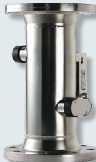
ULTRAFLOW® átfolyásmérő qp 60 - 1.000 m 3 /h